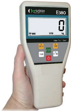
E380 Palm Indicator