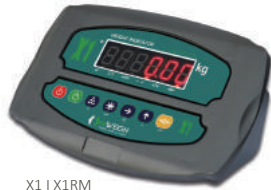
X1 | X1RM