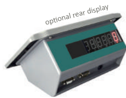
optional rear display