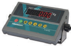
X3AR | X3ARM