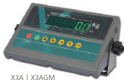
X3A | X3AGM