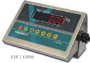
X3R | X3RM