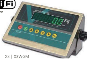
X3 | X3WGM