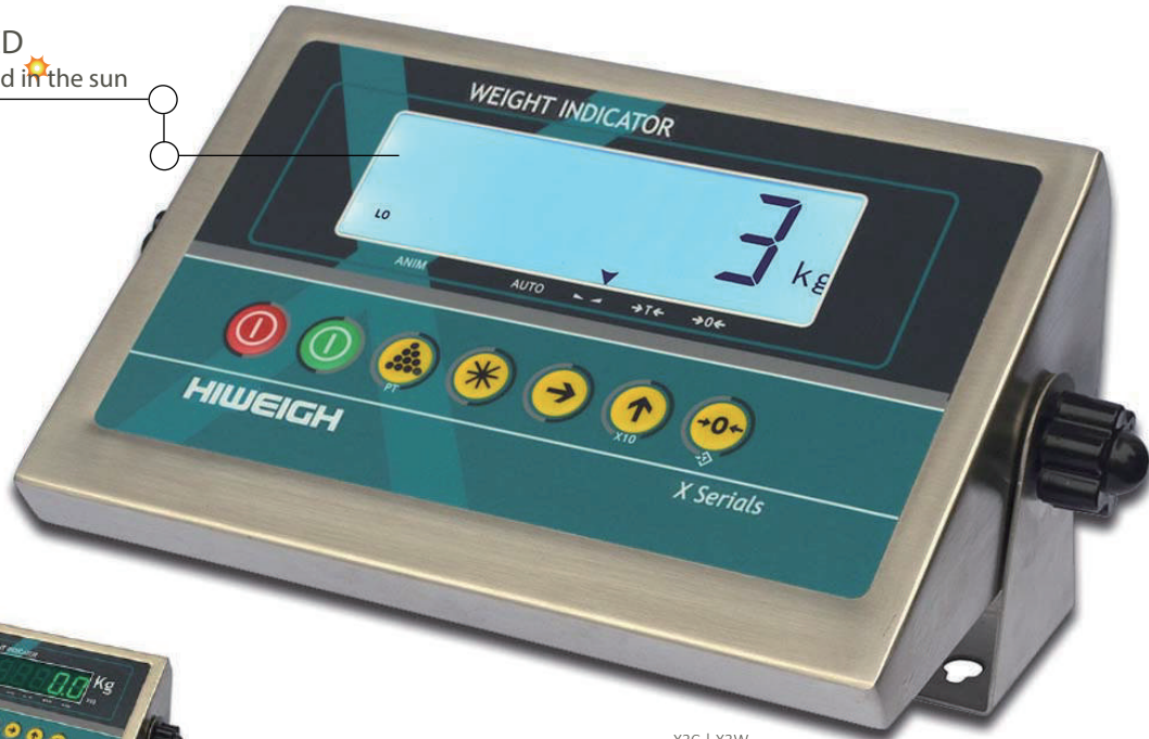
X3C | X3W