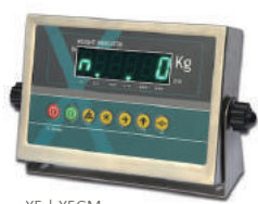
X5 | X5GM