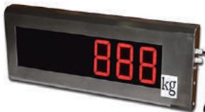
MDS | MDSS Pantalla repetidora de peso remota