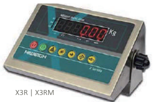
X3R | X3RM