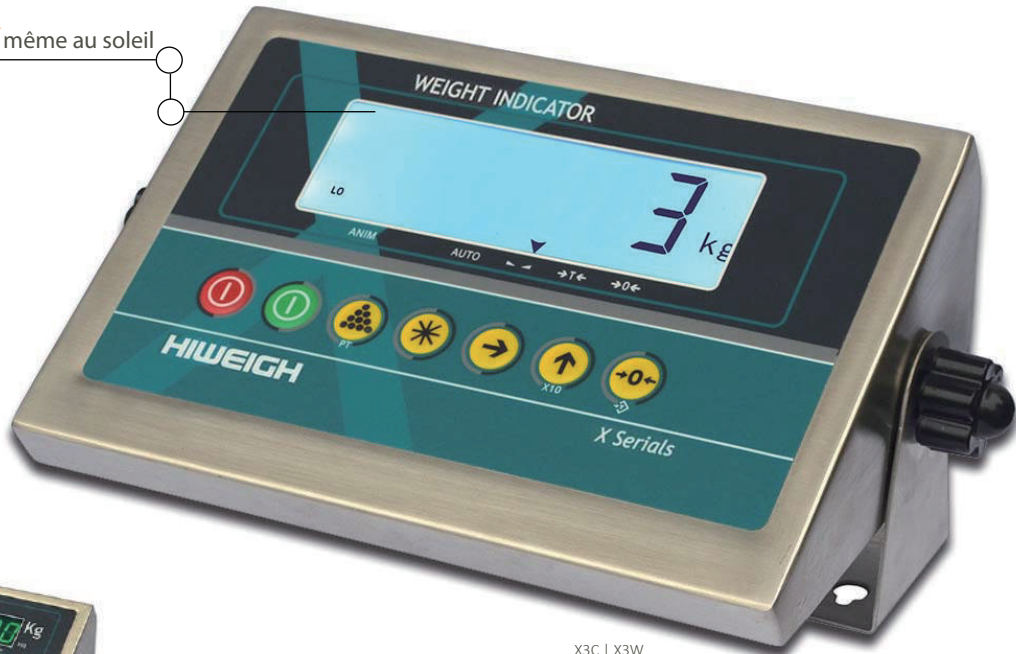
X3C | X3W