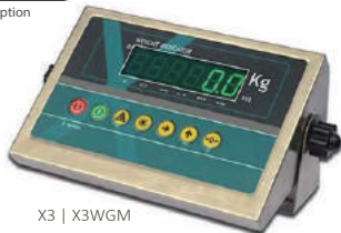
X3 | X3WGM